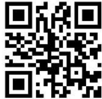
参加申込用QRコード