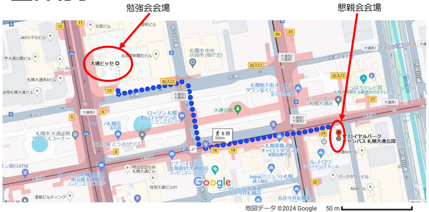
ザ ロイヤルパーク キャンパス 札幌大通公園