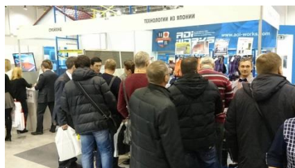
（写真：2017年2月展示会の様子）